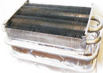
Рис. 3. Теплообменник из меди со специальным покрытием.