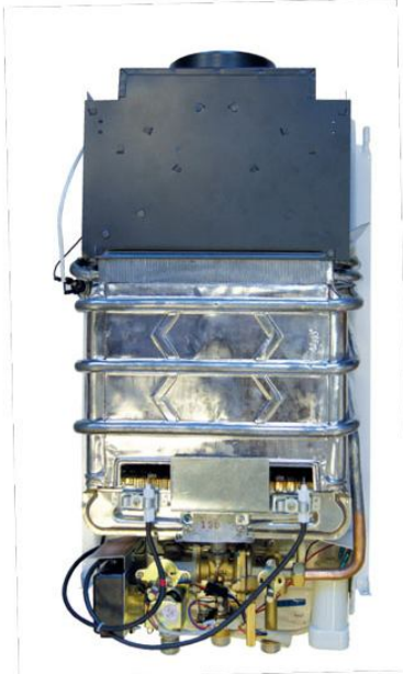
Рис. 1. Колонка без защитного кожуха.

При разработке газовых проточных водонагревателей FERROLI серии Zefiro производитель поставил перед собой задачу создать компактный, безопасный и отвечающий своими функциональными возможностями всем современным требованиям, агрегат. Инженеры и дизайнеры компании "FERROLI" успешно справились с поставленной задачей. Компактный размер водонагревателей достигнут за счет оптимального расположения деталей и узлов, а экономия пространства это один из важных факторов современной жизни. Сегодня при разработке дизайна кухонного пространства каждый сантиметр имеет большое значение. При этом водонагреватели Zefiro соответствуют всем нормам и стандартам, принятым на территории РФ.